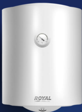
RTT WH 1.5 50