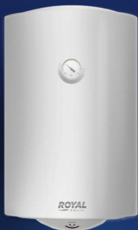
RTT WH 2.0 80