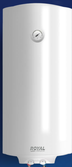
R WH 2.0 120