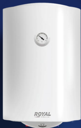
RTT WH 1.5 30