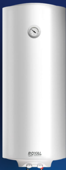
R WH 2.0 150